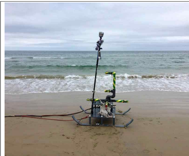
[그림 1] 측정장비 'SELMA'