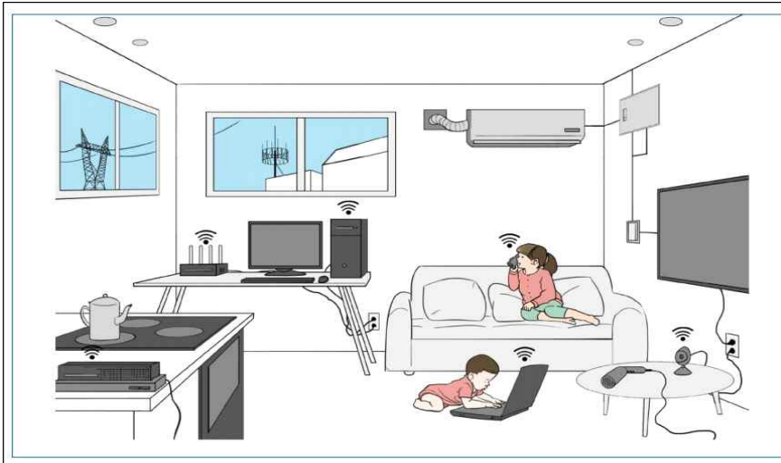
[그림 2] 전자기장의 다양한 출처(EMF)