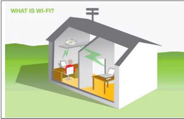
[그림 1] 일반적인 가정환경에서의 Wi-Fi 모뎀 연결도